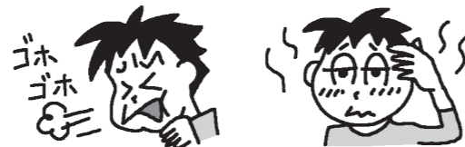
咳、鼻水、くしゃみ等 かぜの症状に加えて… 38~40℃の高熱や、 筋肉や関節など体の痛み

突然高い熱(38~40℃)が出て、咳や鼻水、くしゃみなどの症状の他、筋肉や関節など体が痛くなります。これが通常1週間くらい続きます。インフルエンザにかかると学校は出席停止になります。