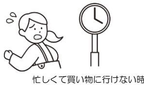
忙しくて買い物に行けない時