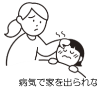
病気で家を出られない

乾燥することで、食品の水分を減らし、菌の増殖を抑えた乾物は常温でストックでき、いろいろな場面で活用することができます。